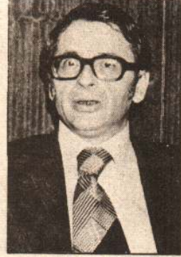
Tanzim Satış Müdürü

zı tahliye etmeleri için işletmecilerini mahkemeye verdik. Özel kişilerin işletmekte olduğu mağazalarımızı belediye olarak işleterek halka ucuz gıda maddeleri satacağız. Bunun yanı sıra kentin çeşitli bölgelerinde 35 tane yeni Tanzim Satış Mağazası açacağız. Piyasada fiyat artışları polisiye tedbirler ile önü alınmadığı için mağazalarımızın sayısını artırarak piyasayı kendi kuralları için de kontrol edeceğiz. Ayrıca bizim fiyatlar ile satış yapacak olan semt bakkallarına da mal vereceğiz. Böylece halkın ucuz gıda gereksinmesini karşılayacağız."