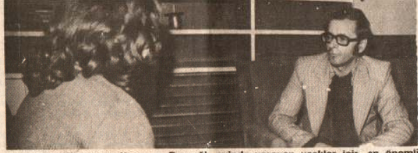
Huzurevleri Kurma ve Yaşatma Derneği evinde yaşayan yaşlılar için en önemli sorunu ısıtma ve temizlik.